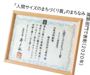
「人間サイズのまちづくり賞」のまちなみ建築部門で表彰(2020年)