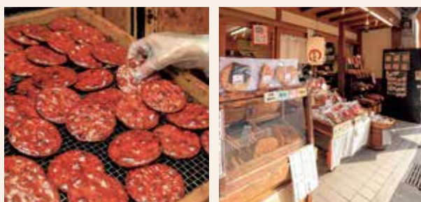
食べ歩きニーズにも対応。焼きたての煎餅をお渡します。

「小規模事業者持続化補助金の資料作りは難しい上に、普通に申請してもなかなか通らない」と聞いたことがありましたが、商工会と一緒に事業計画を考え、整理をくださったおかげでスムーズに申請できました。煎餅の製造は手作業なので大変ですが今回商工会にお力添えいただいた事で、改めて煎餅屋を頑張っ