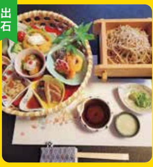
会席料理 二代目 葵 [飲食店] 芳村 英郎

慶事・法事・各種ご宴会の集まりにご利用ください。只今予約制にて営業しております。花籠ランチもご予約承っておりますのでお気軽にご連絡ください。