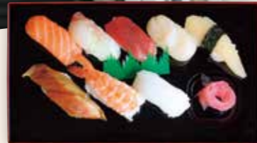
にぎり寿司 人気のネタに絞ることで高いコストパフォーマンスを実現