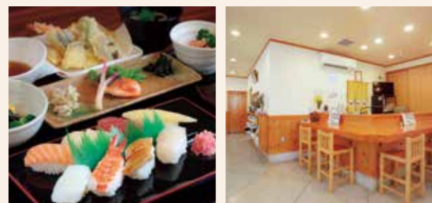
お昼の営業に間に合うよう、早朝から店内で調理

商工会の方と相談しながら、需要が高まっている仕出し部門の強化と新規顧客の獲得に力を入れるという方針を決定。事業承継の補助金を活用して、新しい冷凍庫を導入したり看板や店内のLED化工事をしたりと、店舗内外の設備を充実させました。また、お店の