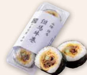
但馬牛巻 すき焼き風に味付けされた但馬牛が玉子で優しく包まれている