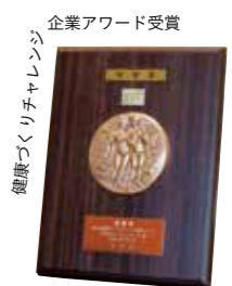
企業アワード受賞