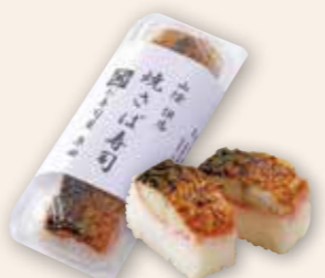
焼そば寿司 甘めのタレ、香ばしく焼いたそば、さっぱりとしたガリの共演

情報を継続的に地域の皆さまに発信するために、2021年からフリーペーパーや新聞折込みに広告を掲載しています。継続的に掲載できるのは補助金があってこそ実現したことだと感じています。