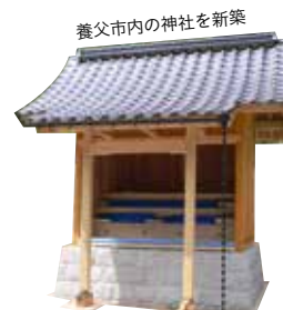
養父市内の神社を新築