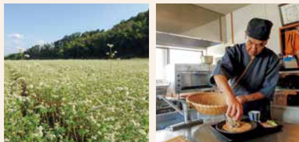
そばの種植えから刈り取りまで一貫生産して提供している。