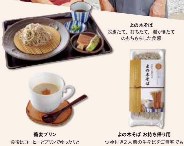
蕎麦プリン 食後はコーヒーとプリンでゆったりと