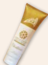
Chalklate Liquid White 液体タイプで軽く乾くクライミングチョーク