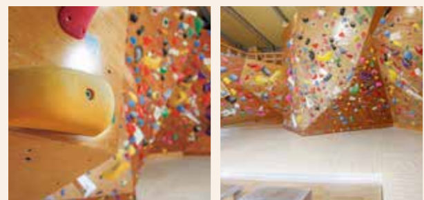
都会にも負けない本格的なコースは50以上