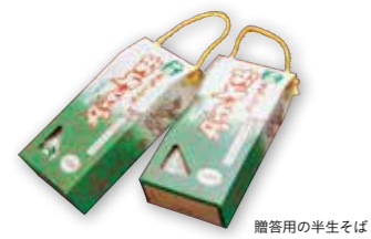
贈答用の半生そば

いと考えると、西宮の日本料理屋で3年間修業。日本料理の基礎と、あらゆる種類の魚を調理する技術を習得しました。その経験を、夜の部に提供している天ぷら、刺身などのメニューに生かしています。