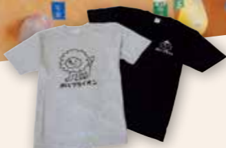
Boulder plus オリジナルTシャツ ボルブライオンとボルブランクは齋藤さん原案のキャラクター