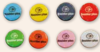
Boulder plus 缶バッジ 壁面のホールドのようにカラフル

客を獲得するための計画を考えることに。店の看板やショップカードを作るために、商工会の方から様々なアドバイスをいただきながら小規模事業者持続化補助金の活用にいたしました。また翌年は新事業としてSUP*やカヌーといったアクティビティとボルダリングを組み合わせた事業展開を考え、二度目の補助金も採択していただけました。