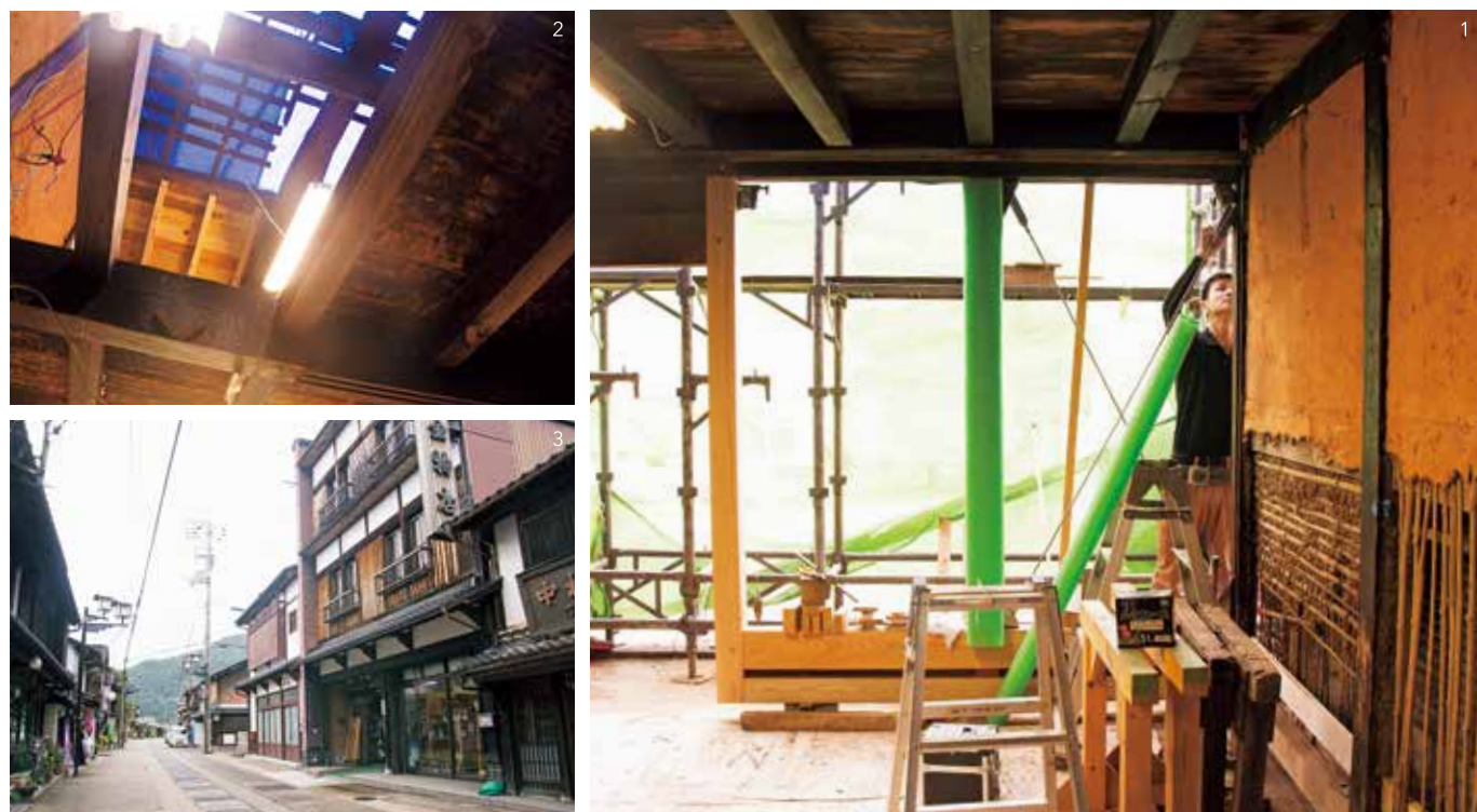
1. 空き家の改装風景 2. 設計士と共に調査しながら当時の状態により近くなるよう改修していく 3. 町並みの景観を損なわないよう一般の住宅にも統一性を持たせる必要がある 4. 初代 瀬尾品蔵氏の技術と知識が100年経った今でも継承され続けている

infomation 住 所/豊岡市出石町嶋777 TEL/079615215073 営業時間/8時~17時 定休日/日曜日・祝日 web/https://sookenseisui.com/