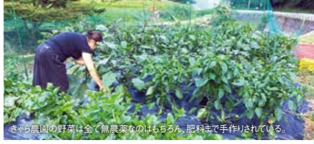
きやら農園の野菜は全て無農薬なのはもちろん、肥料まで手作りされている。