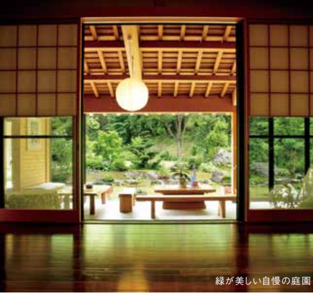
緑が美しい自慢の庭園

少ない人数でお店をしているので、もちろんしんどい部分も沢山あります。掃除、料理の仕込み、畑仕事まで毎日やるべきことは山のように大変な分、お客様が満足してくださることを励みに、そして楽しみに頑張っています。色々な目的を持ってやって来られるお客様。旅の休息地としてたくさんあるお宿の中からきやらを選んでいただくに、お客様に、より良くハッピーになって帰ってもらえるように心がけ、これからも妻と2人で気ままにお店をやっていきたい、これに尽きます。