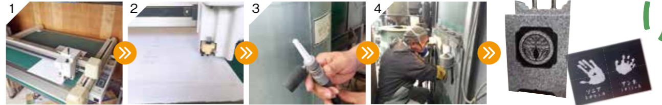
①②ゴムシートに印字・切り抜き → ③砂を先端から吹き付ける → ④四方を囲った台に石を乗せ、手を入れて彫っていくが、粉塵が出るのでマスクが必須となる