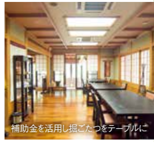
補助金を活用し掘ごたつをテーブルに