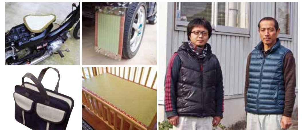
畳の素材を活かした商品づくりも行っている。

化繊素材を違った観点で応用できないかと思いつき、トラックの泥除けやバイクのシート、ベビーベッド用の畳など新しいものづくりに力を入れており、豊岡の素材として使っていたこともございます。ご要望がございましたら対応させていただきますので、異業種の方からの目線で新たに活用できそうな案件があればご連絡お待ちしております。