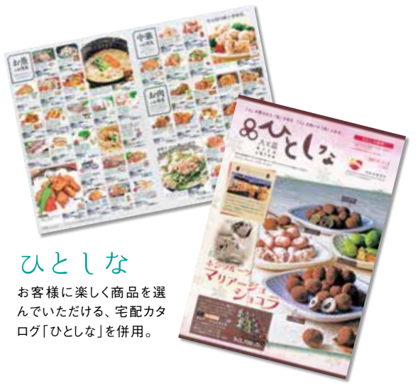
ひとしな お客様に楽しく商品を選んでいただける、宅配カタログ「ひとしな」を併用。

田舎暮らしは、自分の生きる意味を見いだす、ということにおいて最適な環境だなと思います。年々歳を重ねるにつれ、そう感じるようになりました。若い人は特に、買い物ができる場所や娯楽が少ない、つまらない場所と思われ方も多いと思います。でも、昔はそういうものが無くても楽しく暮らしていたじゃないですか。都会での娯楽よりも、畑仕事であったり魚釣りであったり、田舎で出来る趣味の方が長く楽しめる気がします。自然とともに生きていくと、生活や心にゆとりも出ます。私自身、都会で暮らしていた頃は自分のことで精一杯でしたから、自分の行動が目に見えて地域貢献に繋がるところも、私にはあっているみたいなんです。例えば都会で自分の意見が市政に反映されることなんてまず無いに等しいですが、田舎の小さい町だと自分の意見を直接伝える機会も多いので、町づくりに関わっているなど実感できます。高橋地域には空き家が100軒ほどあるので、その空き家を調査して住めるように整えて、都会からのUターン希望者を受け入れられるようにしていきたいです。少しずつですが移住者は増えてきており、自分たちが取り組み始めてからでも5軒ほど増えました。これに満足せず、もっと住みやすい土地になるように頑張っていきます。