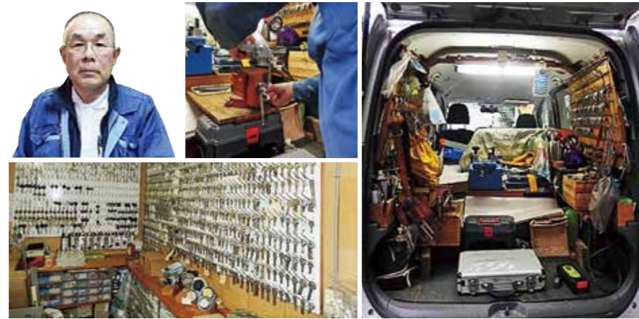
電子キーなど様々な鍵作成を行います。