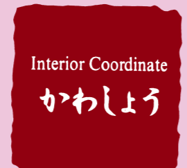
かわしょう (内装業) 川崎 昭博

内装工事全般お任せください。昭和63年12月の開業です。兵庫県知事許可 第651350号