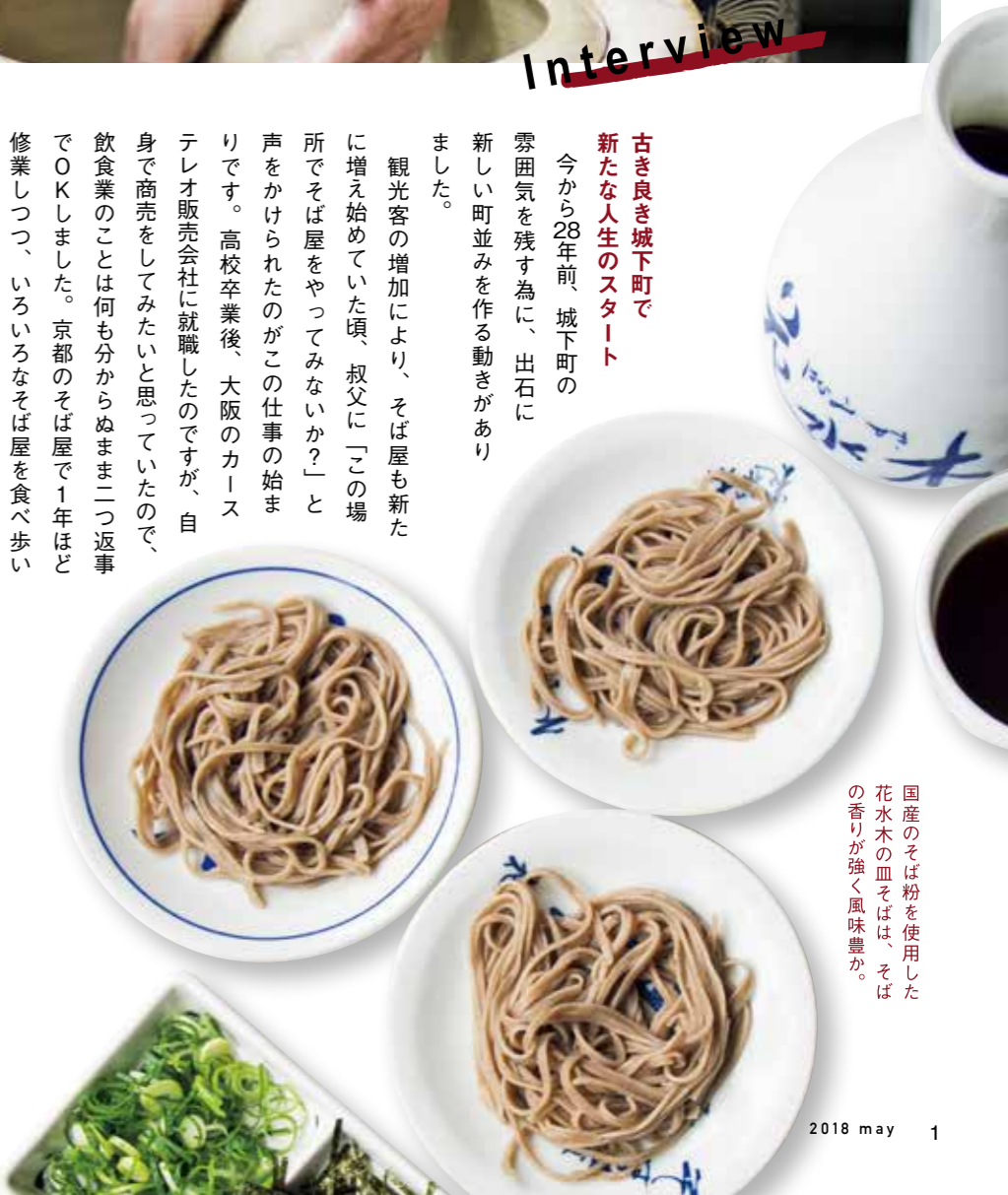
国産のそば粉を使用した花水木の皿そばは、そばの香りが強く風味豊か。

最近では、Uターンしてそば屋を始めたり、県外から出石にやってきて店をしている若者も増え、自分たちの次の世代が地域を盛り上げようと頑張ってくれているのが嬉しいです。私も負けてはいられません。これからの出石が楽しみです。