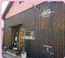
dada TABERIBA (飲食業) 岡田 大輝

〒669-5362 豊岡市日高町芝330-1 TEL/080-3845-6510 営/昼10:30~15:00 夜19:00~24:00 休/月曜日