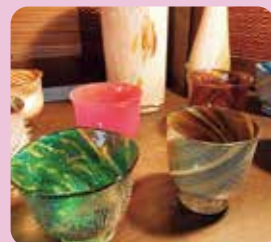
Glass Studio Libra (ガラス製品の製作・販売・吹きガラス体験) 工藤 千晶

〒668-0221 豊岡市出石町町分150-3 TEL/34-8192 FAX/34-8194 営/9:00~18:00 mail/2848@takuhaicook123.jp