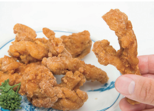
◀新日高名物「ひだか松葉」。松葉は他の部位よりもヘルシーなので、女性人気も期待される。焼いたり揚げたり、色々な調理法で楽しめます。