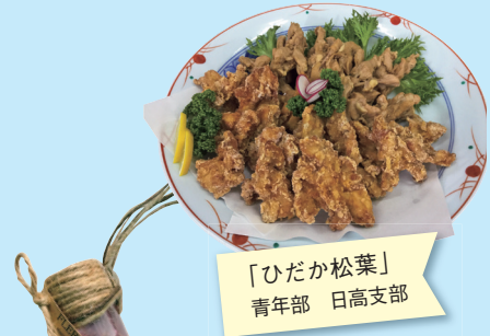
「ひだか松葉」 青年部 日高支部