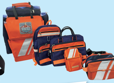
「医療緊急バッグ」 オンザロード