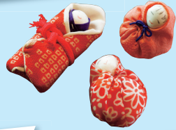
「子宝人形」 床瀬そば