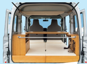
「ちょいCam」 福住オートサービス