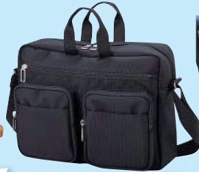
「楽バッグ」 （株）かばんらぼ