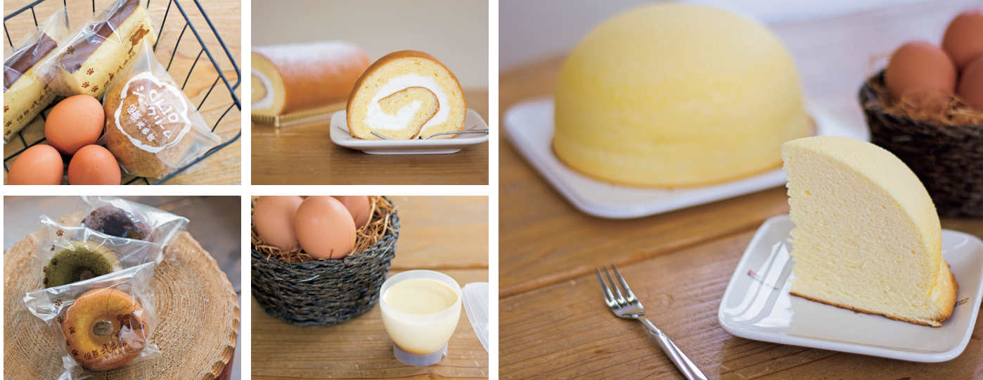
▲ 人気のスコッチチーズケーキやプリンなど、卵の香りいっぱいのお菓子たち。防腐剤や保存料を使用しておらず、小さなお子様からお年寄りまで安心して食べられます。