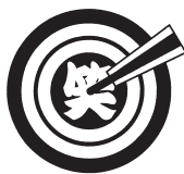
いざし落語笑学校

はなですけど、ずっとそんな父たちを誇りに思っています。出石の父も商工会の支部長として町づくりに積極的な人で、私が出石に来て間もない頃、「観光ってどういうことやと書くますよね。光というのは箱物とか名物の食べ物ではなく、そこに住んでいる人のことだと言っています。当時はまだ若かったのでピンときませんでしたが、年を重ねるにつれてそれが段々分かるようになってきて。そんな父たちの影響があって、町おこしや人おこしには精力的に取り組んでいて、笑いで出石を元気にしようというコンセプトの「いざし落語笑学校」のメンバーとして年に2回永楽館で落語をしています。また、出石の父の勧めで入部した商工会青年部に18年在籍したこ