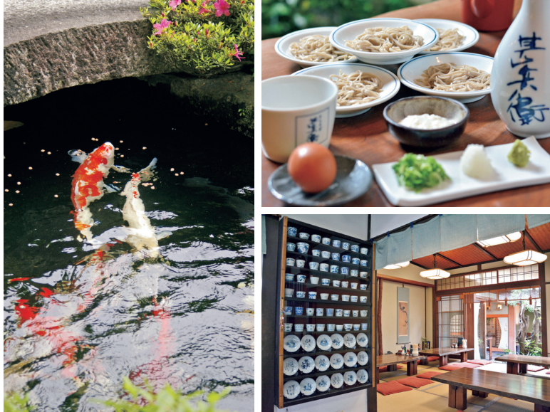
店内のすべての部屋から庭を眺めることができ、四季を感じながら蕎麦を味わえる。ミシュラン・グリーンガイド・ジャポンでも紹介された世界が認める味。

はなですけど、ずっとそんな父たちを誇りに思っています。出石の父も商工会の支部長として町づくりに積極的な人で、私が出石に来て間もない頃、「観光ってどういうことやと書くますよね。光というのは箱物とか名物の食べ物ではなく、そこに住んでいる人のことだと言っています。当時はまだ若かったのでピンときませんでしたが、年を重ねるにつれてそれが段々分かるようになってきて。そんな父たちの影響があって、町おこしや人おこしには精力的に取り組んでいて、笑いで出石を元気にしようというコンセプトの「いざし落語笑学校」のメンバーとして年に2回永楽館で落語をしています。また、出石の父の勧めで入部した商工会青年部に18年在籍したこ