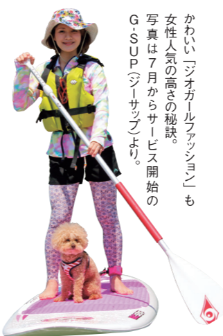
かわいイオオカルフアッショも女性人気の高さの秘訣。写真は7月からサービ開始のG・S・U・P（ジー・サブ）より。

雑誌や情報誌で紹介してもらつた際に綺麗な海の写真や美しいものなど女性が好みそうなものも載せて興味を引くよう工夫したり、妻にも「ジオガール」として他のインストラクターに混ざつてメディアに広報を付けてもらい、イメージ戦略を計つていきました。その甲斐あつてか順調に売上も伸び、今年5月に株式会社マザーアースとして法人化する運びとなりました。