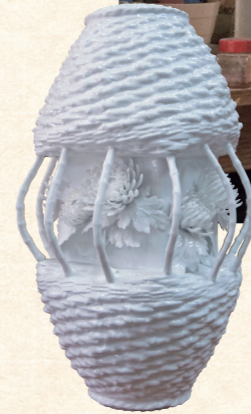
「但馬で創作するやきもの展」 にも展示された作品