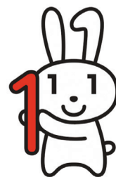
マイナンバー マイナンバーキャラクター マイナちゃん