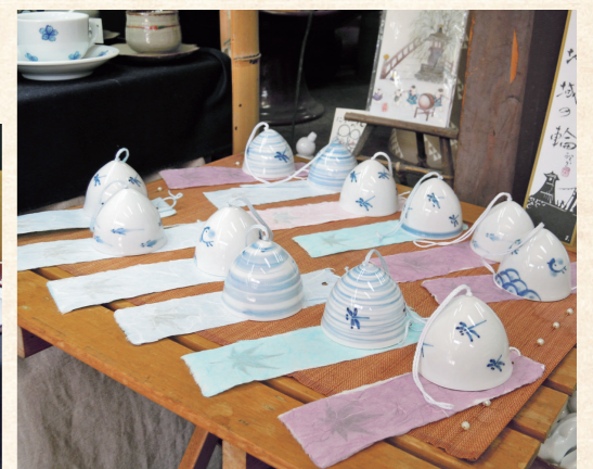
季節を問わず人気の雛人形や兜、風鈴

出石焼 虹洋陶苑 〒668-0225 兵庫県豊岡市出石町八木57 TEL 0796-52-5945 webサイト http://www.kouyoutouen.com/