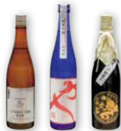
物の3本。 【香住鶴株式会社】吟醸純米「KONOTORI LEGEND」 【此の友酒造株式会社】純米吟醸「加古屋」や 【与謝娘酒造合名会社】純米吟醸「越光」(50音順)

1.本日の3種おまかせ飲み比べセット。お猪口は地元の作家の作品たち 2.てらたに酒店オリジナルの「翼のビール」 3.井上茶寮さんのチョコレートカヌレ羊羹。日本酒との相性も抜群 4.イラストレーター Bullさんが書いたTシャツは海外の方にも人気 5.天井高く開放的でおしゃれな内装