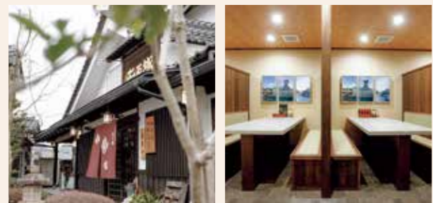
玄関周りは庭木を植え替え、竹垣を設置した

住 所/豊岡市出石町町分189 TEL. 0796-52-2552 定休日/不定休 営業時間/10時~17時 Web/http://www.izushijyo.co.jp/