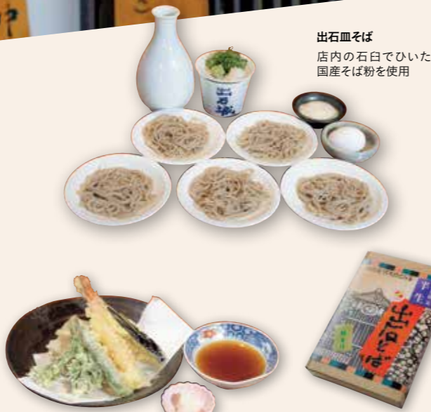
天ぷら 四季の食材を薄衣に閉じ込めた