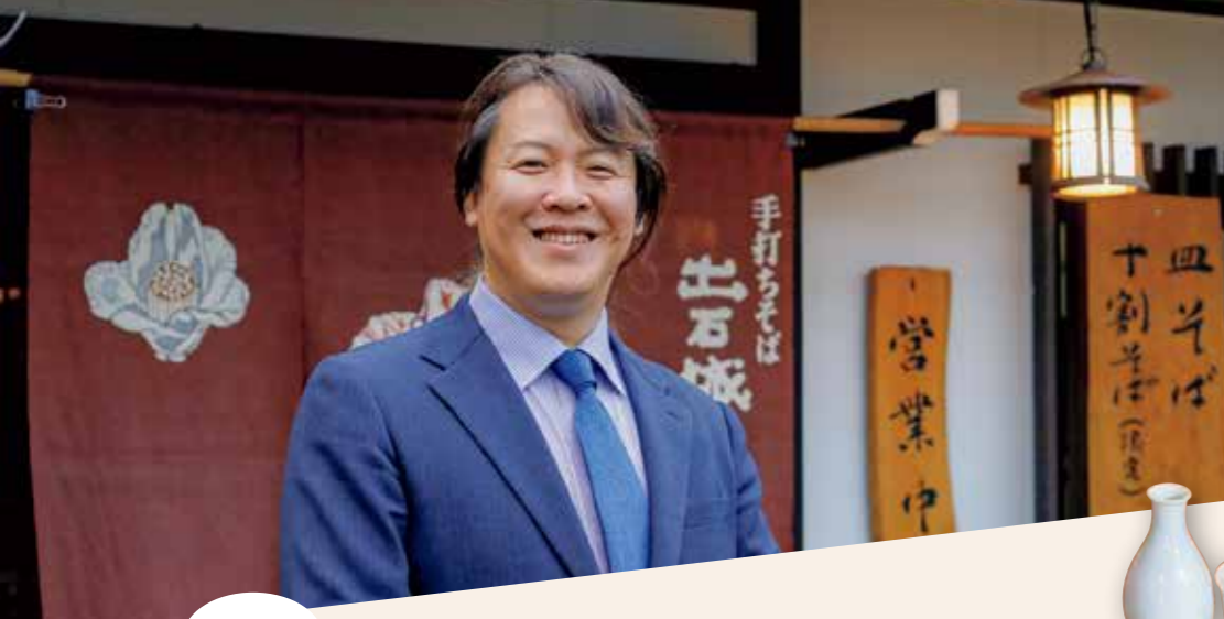
出石そば 店内の石臼でひいた 国産そば粉を使用