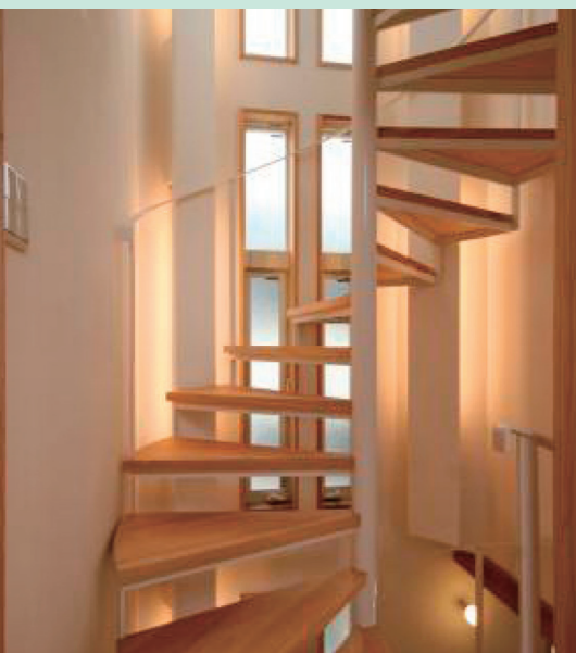
間接照明に照らされた螺旋階段