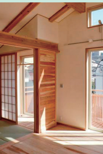
建具に無垢の杉材をふんだんに使い、見た目にも木が表され、とても良い杉の香りに満ちた住宅です。