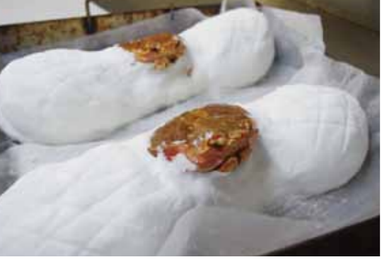
かにかまくら1つにつき、使用する塩は約500g。焼き上がりを調整するため甲羅部分は外に出す。真っ白な塩がまさに雪のかまくらのよう。

ありがたい事に当館は、これらのお客様方により支え続けられてきて、26歳の時先代より旅館の経営を引き継いでからここまでやって来る事が出来ました。本当に本当に感謝しております。