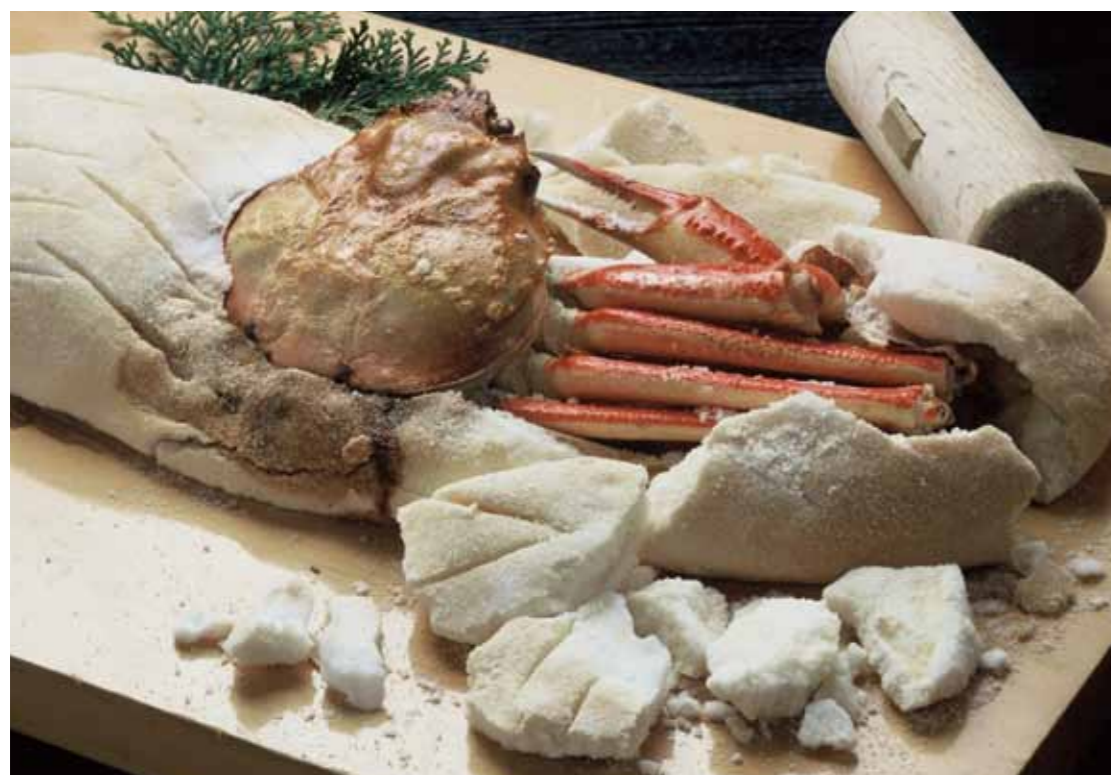
食べる時は塩釜部分を木槌で割る。鏡開きのようで、お祝いの席でも人気。