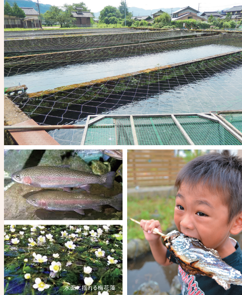
水面に揺れる梅花藻