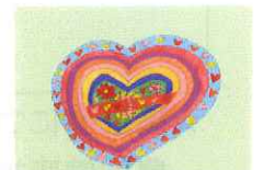
地域・職域こころのケア対策検討会 シンボルマーク