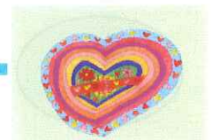
地域・職場こころのケア対策検討会 シンボルマーク