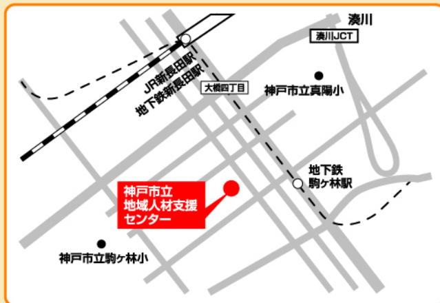
JR神戸線・地下鉄西神山手線/海岸線「新長田」駅より南へ徒歩約13分 地下鉄海岸線「駒ヶ林」駅出入口1より西へ徒歩約6分