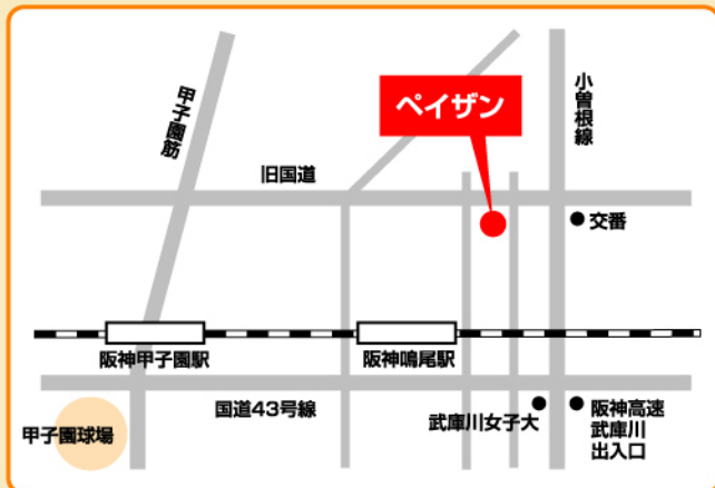
阪神「鳴尾」駅より北へ徒歩約5分