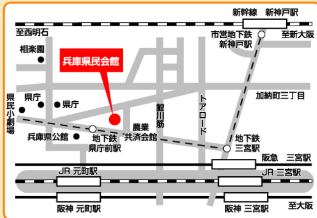
JR「元町」駅西口・阪神「元町」駅より北へ徒歩約7分 地下鉄「県庁前」駅 東1・2出口 下車すぐ