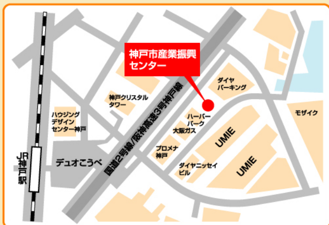
神戸高速鉄道「高速神戸」駅より徒歩約8分 地下鉄海岸線「ハーバーランド」駅より徒歩約5分