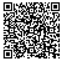
▲豊岡市ホームページ